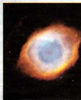
Nebulosa Al telescopio