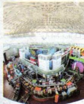
Acceleratore Istituto nucleare

I visitatori potranno ammirare le stelle dall'osservatorio di Monte Porzio Catone, visitare la sala monitoraggio dell'Istituto Nazionale di Fisica e Vulcanologia o ascoltare il suono delle onde nello spazio. All'esterno dei laboratori, gli spettacoli «Kyoto fisso» e «La chimica in casa» per esplorare in maniera divertente i misteri della materia e dell'energia nucleare.