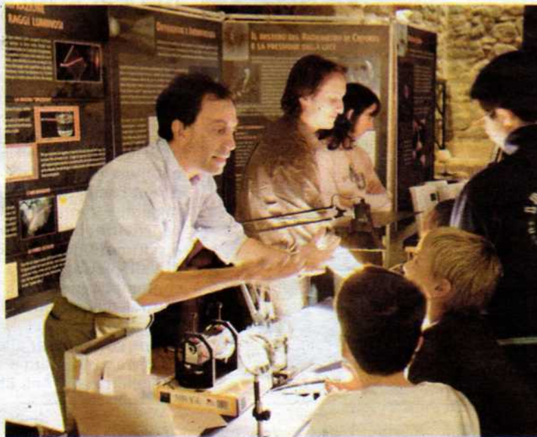
Lezioni I ricercatori Enea spiegano gli esperimenti a piazza Marconi

A Frascati, dove si trova la più grande concentrazione a livello internazionale di laboratori scientifici, si svolgeranno spettacoli, esperimenti dal vivo e conferenze per gli alunni delle scuole di tutti i gradi. Per il prossimo giovedì è previsto l'incontro, presso i laboratori Esa, con l'italiano Paolo Nespoli e la statunitense Cady Coleman che hanno passato quasi sei mesi a bordo della Stazione Spaziale Internazionale. Fino al 22 settembre in piazza Marconi sarà invece possibile maneggiare alambicchi e microscopi prendendo parte agli esperi-